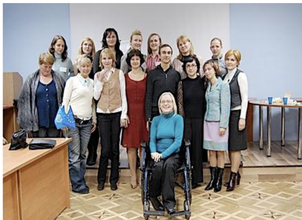
Більше 100 жінок після відвідування тренінгів були готові розпочати власний бізнес

У рамках проекту ЄС-МБП «Рівність жінок і чоловіків у світі праці» впродовж 2010 року Ресурсним центром ГУРТ у 12 областях України були проведені тренінги за програмою «Розпочни і вдосконалюй свій бізнес», участь у яких взяли більше 700 учасниць. До участі в тренінгах запрошувались жінки, які нещодавно започаткували свій бізнес або планували це зробити незабаром. Розроблена Міжнародним бюро праці (МБП) тренінгова програма «Розпочни і вдосконалюй свій бізнес» впроваджувалася за стандартами МБП досвідченими тренерами, сертифікованими МБП.