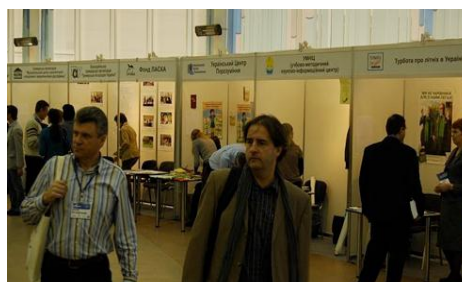
У межах 18 майстер-класів, експертних дискусій, презентацій була розпочата дискусія про майбутнє ринку розвитку для ІГС

Більше 250 лідерів впливових ІГС, донорських та комерційних організацій взяли участь у цьому заході (захід спочатку планувався для 150 учасників). Під час Ярмарку тривала постійна виставка-презентація 33 провайдерів тренінгових послуг.