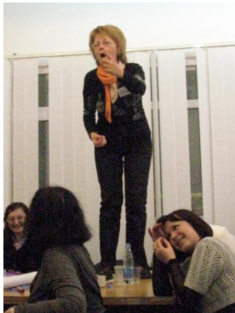
60 представників ІГС із Полтави, Луганська, Херсона та Сум взяли участь у дводенному тренінгу з адвокати та розвитку партнерства

Метою поїздки буде не тільки отримати ґрунтовні знання про те, яку роль громадянське суспільство повинно відігравати в демократичній державі, а й поділитися планами на майбутнє, обмінятися ідеями щодо реалізації спільних проектів.